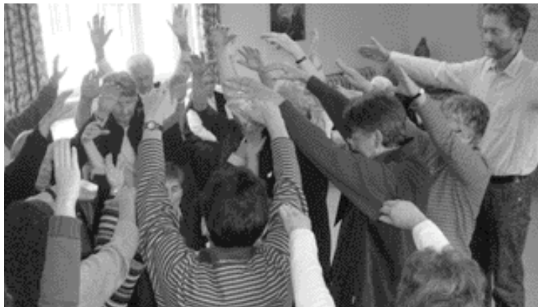
SING-ATEM-SPIEL Der ganze Körper tönt.

„Alles, was Atem hat, lobe Gott.“ Unter diesem Motto fand in Schaan ein etwas anderer Stimmbildungstag statt.