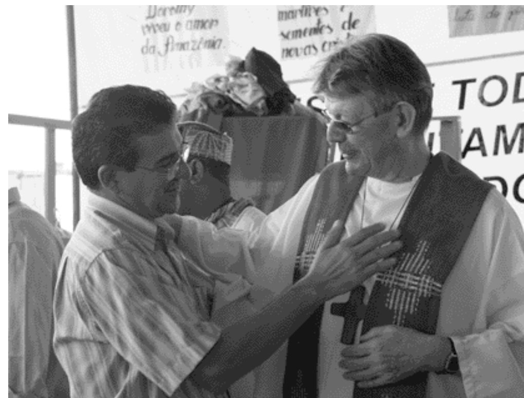
ERWIN KRÄTLER Ein Bischof, derinhört und versteht.

freiungstheologie wird in Europa oft so als marxistisch verbrämte Theologie angeschaut. Das ist absolut nicht wahr. Ich bin überzeugt, dass die Befreiungstheologie biblisch ist. Gott ist nicht ein Gott in weiter Ferne, sondern ein Gott, der herabgestiegen ist, der gesagt hat ‚Ich habe das Leid meines Volkes gesehen und bin herabgestiegen, um es aus der Sklavenhütte Ägyptens zu befreien‘ – das ist Befreiungstheologie pur.“ wut