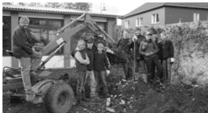
MACHT SPASS Arbeitsbeginn in den Herbstferien.